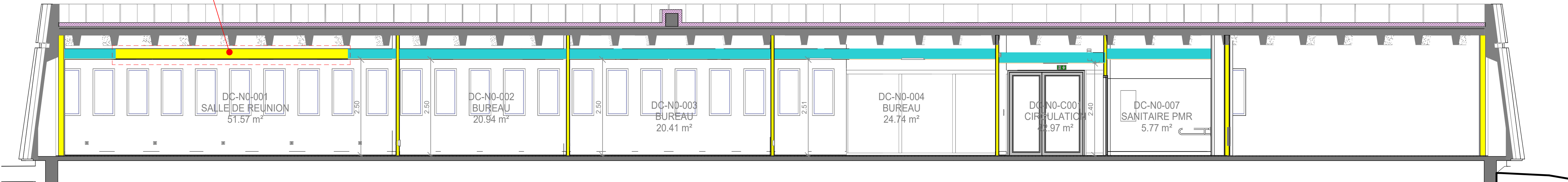
2 Coupe AA_Lot 05_Isolation plafond 1 : 50